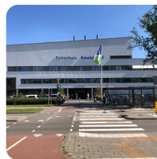
Ziekenhuis Amstelland Amstelveen