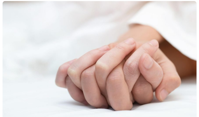
Expertiseteam Seksuele Gezondheid