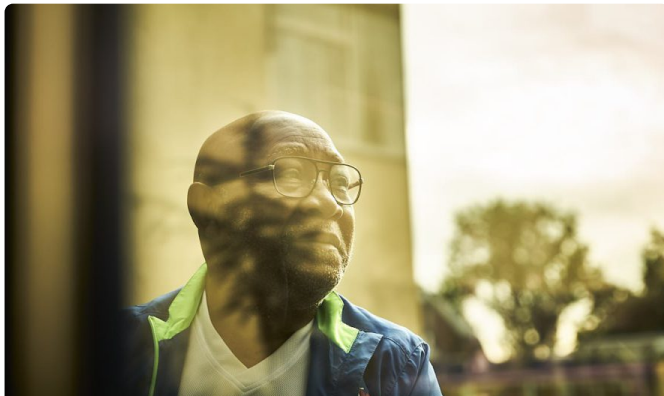
MS Groepsprogramma 'De onzichtbare gevolgen van MS'