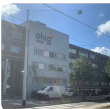
OLVG, locatie West Amsterdam