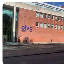
OLVG, locatie oost Amsterdam