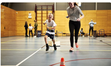
Kinderen 0 - 12

Klik op een van de afbeeldingen en lees meer over hoe het werkt voor die (leeftijds-) categorie.