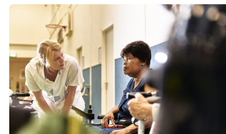
Al onze zorg