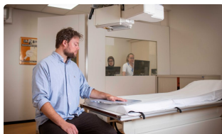
Ondersteunende zorg & diensten