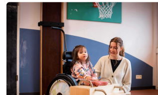
Kinderen & Jongeren