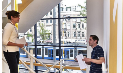
Verwijzen en Overleg