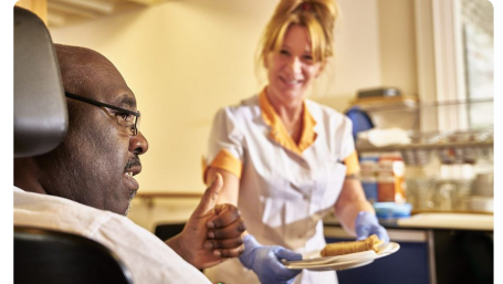
Jouw mening telt