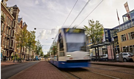
Contact en locaties