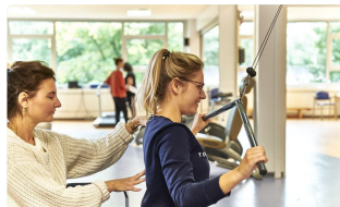
Cardiovasculaire comorbiditeit bij reuma