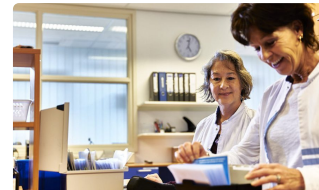
Effectiviteit van biologische therapie