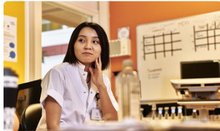
Verpleegkundigen kiezen koers